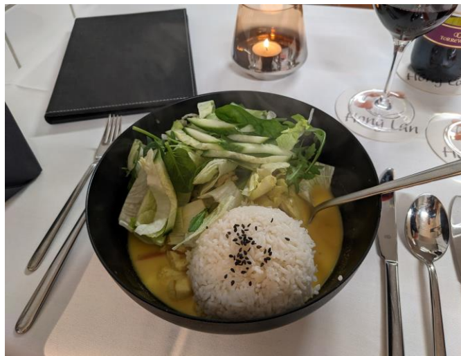
Curry Bowl mit Reis

CURRY BOWL vegetarisch, pikant mit Reismudeln und Tofu 14,50 €