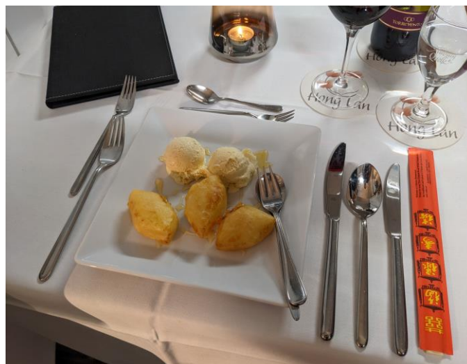
Gebackene Ananas mit Vanilleeis