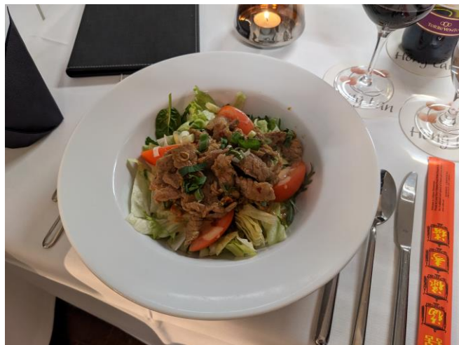
Bo Luc Lac